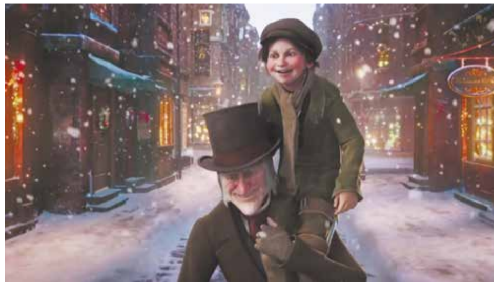
Кадр из мультипликационного фильма «Рождественская песнь». ПРОИЗВОДСТВО «WALT DISNEY»

Ещё мальчиком очень впечатлительный Чарльз был вынужден работать на фабрике по производству ваксы, чтобы помочь семье свести концы с концами, по-