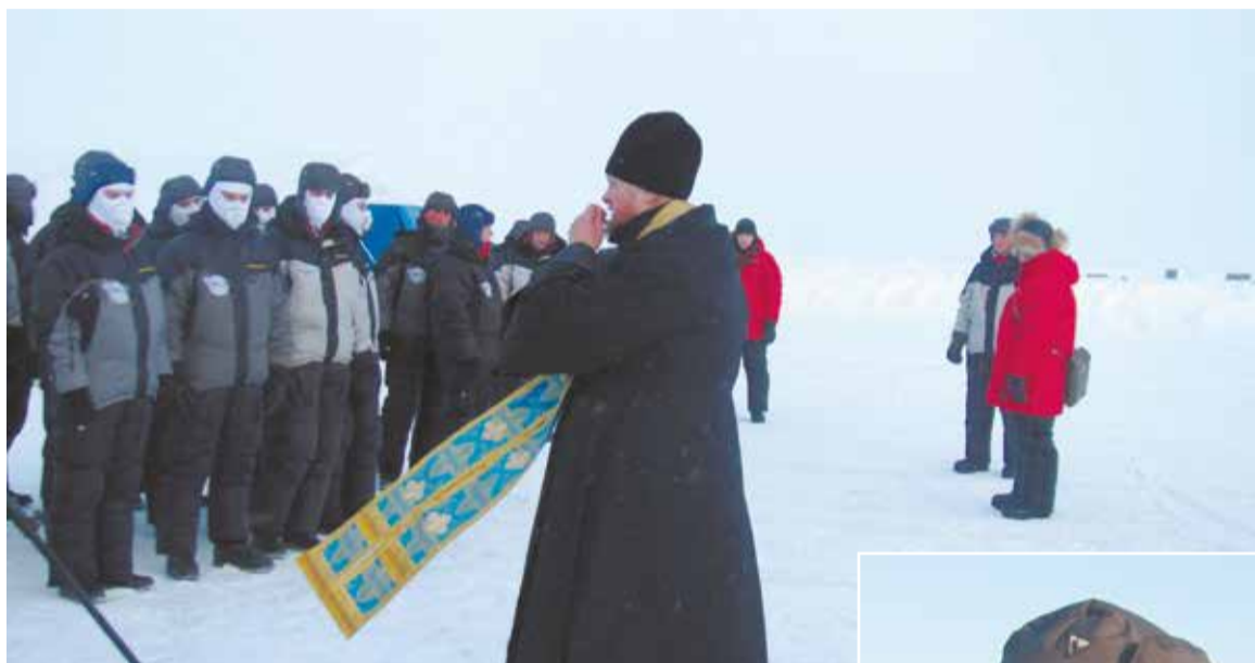
Во время молебна.

Вот и на высоте 1500 метров над Северным полюсом – ощущение планеты как целого.