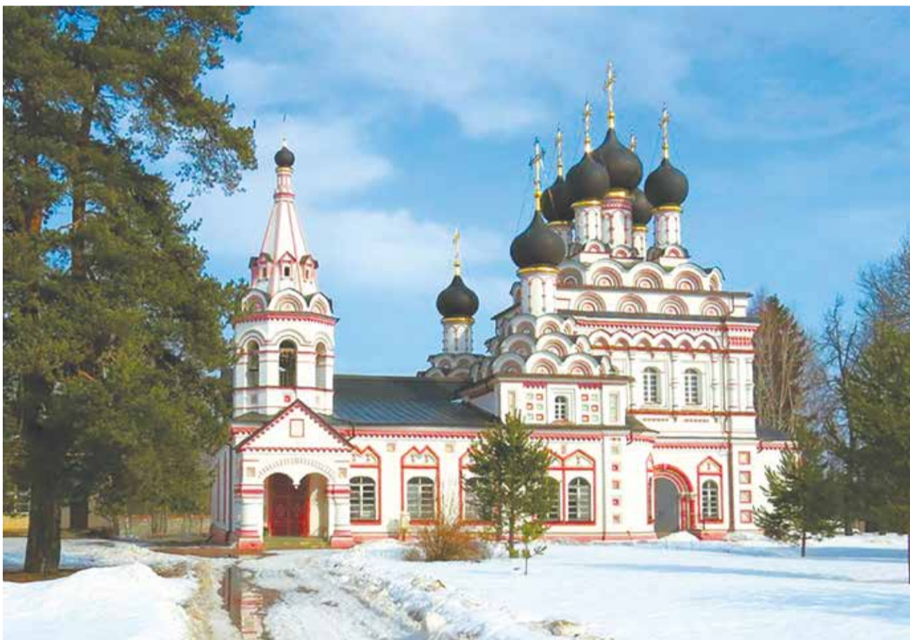
Троицкий собор Александрово-Невского женского монастыря. С. Акатово, Клиновское благочиние.

В 2021 году в России широко праздновалось 800-летие со дня рождения святого благоверного князя Александра Невского. Ему открывали памятники, посвящали многочисленные выставки и круглые столы, издавали о нем книги. Этого святого любят и почитают не только в России. Освященные в честь него храмы есть практически во всем мире – нет их только в Австралии и Южной Америке.