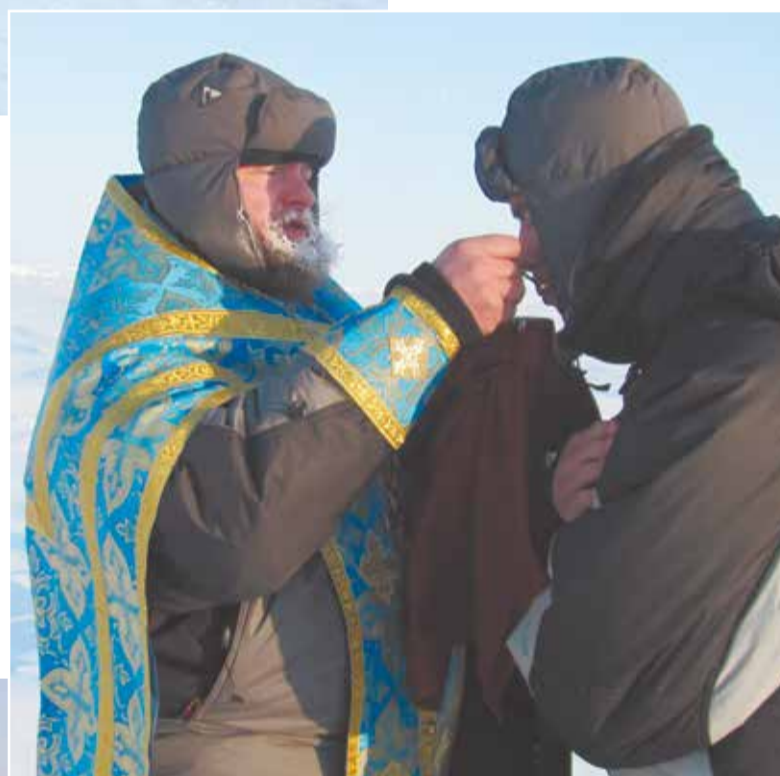
Причащение десантника после таинства Крещения.

Нам устроили ознакомительный поход на лыжах – ходят там на какие-то расстояния именно на лыжах, вещи при этом тащат за собой на верёвке в небольшой байдарочке, потому что ты в любой момент можешь провалиться в трещину, то есть в воду. Трещина может быть слегка приморожена и покрыта сне-