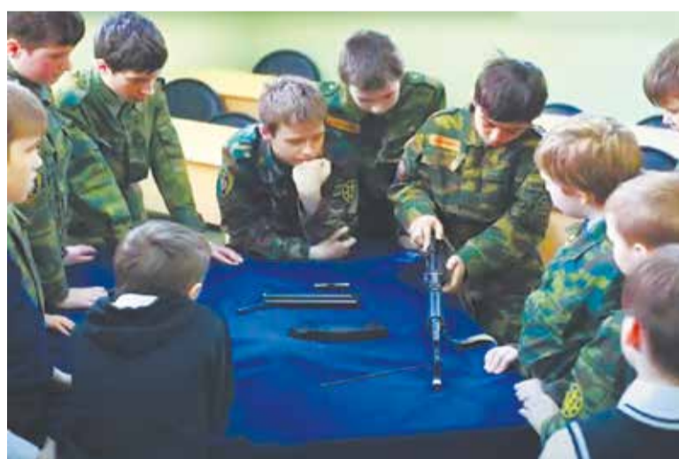
Воспитанники клуба им. св. блгв. кн. Александра Невского.

– Перед смертью Александр Невский принял монашеский постриг. Почитание князя началось практически с его кончины. Бытует мнение, что Церковь причислила его к лику святых именно в знак его воинских доблестей. Насколько это правильно?