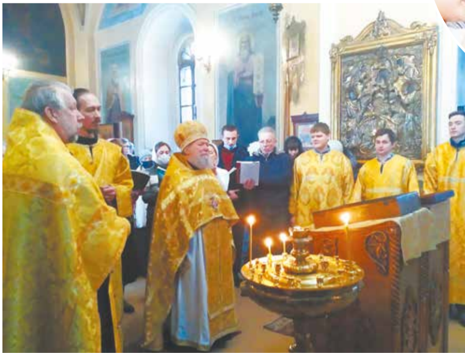
На новогоднем молебне в Скорбященском храме г. Клина.

Новый год является хорошим гражданским праздником и никакого духовно-благодатного значения для нас не имеет.