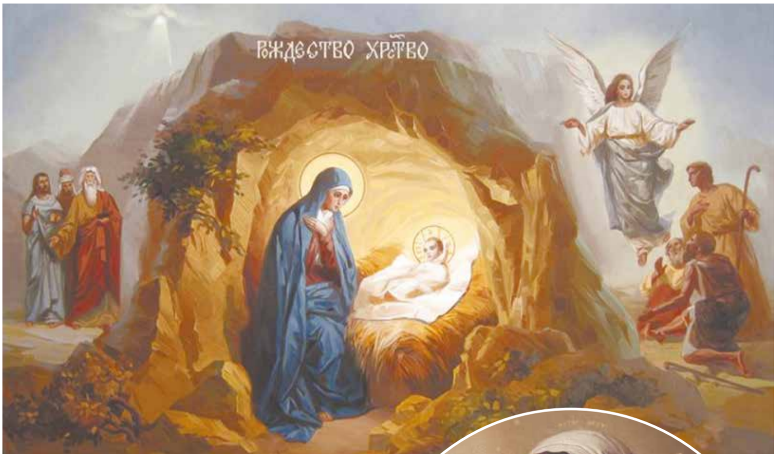
Икона «Рождество Христово».

Закономерным результатом этого преступления стало искажение самой природы людей – как телесной, так и духовной.