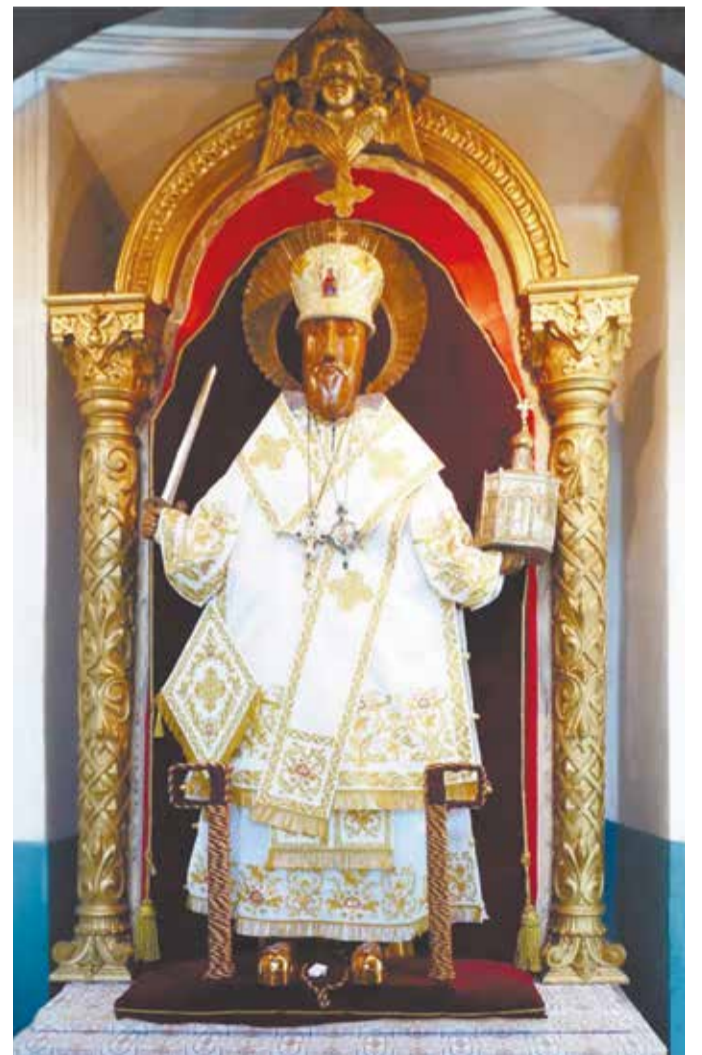
Резной образ свт. Николая в храме с. Спирово.

В Клинском благочинии в с. Никольском находится храм святителя Николая Чудотворца (престольный праздник – 19 декабря и 22 мая).