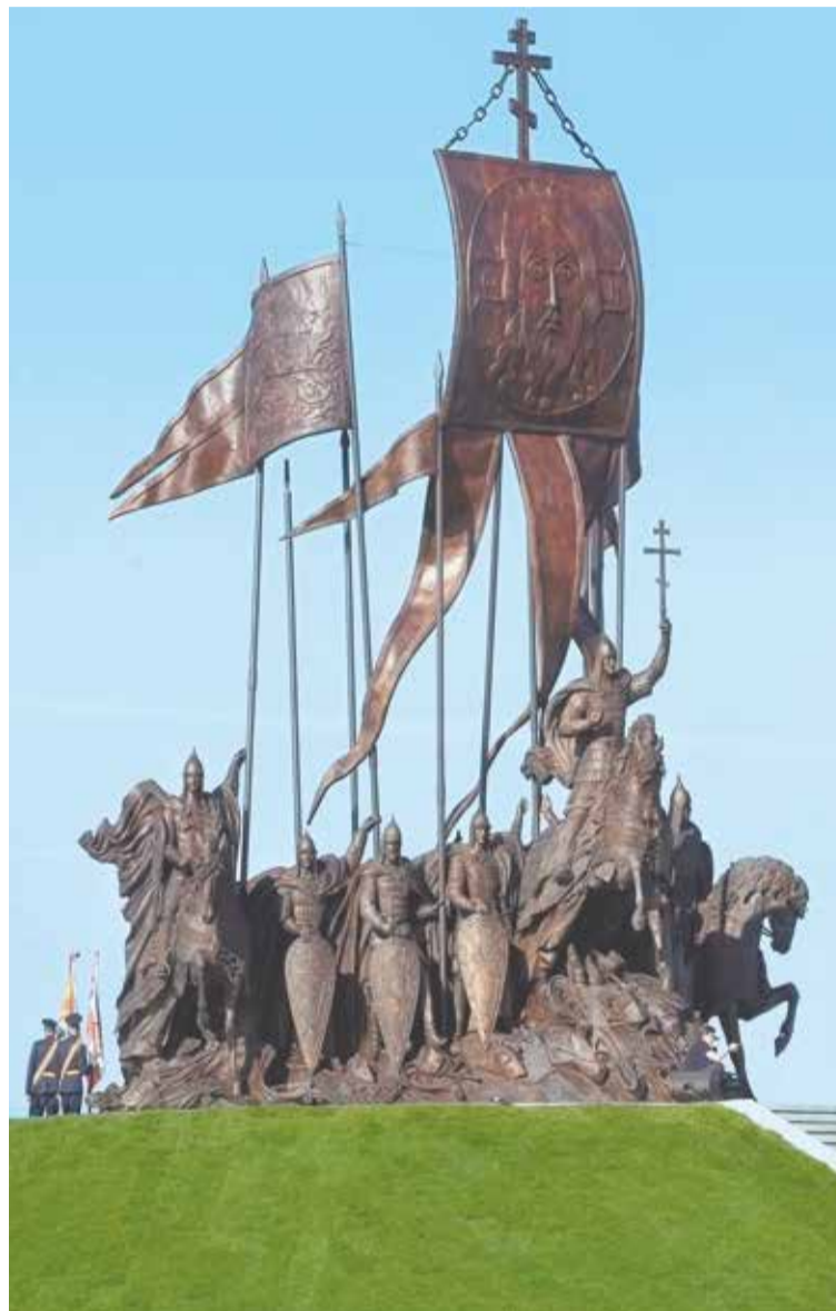
Мемориальный комплекс «Александр Невский с дружиной», открытый 12 сентября 2021 года в Псковской области на берегу Чудского озера.

мент привело бы к тому, что Русь была бы полностью опустошена, здесь бы просто выли волки в пустых деревнях. И Александр Невский это понимал, хотя, я думаю, его многие упрекали в заискивании перед ханом, в том, что он предал Русь ради того, чтобы получить власть. Вопреки всему он поступил по-христиански мудро, предпочитая откупиться данью и тем сохранить народ и православную веру. В конце концов, материальные богатства можно заработать еще, а вот жизни человеческие, воспитание людей в вере – это стоит того, чтобы быть «смирненным на Востоке». Поэтому воин, которому наверняка было очень тяжело перешагивать через свою доблесть, отвагу, героизм, шел на поклон к хану. Но это было не просто какое-то раболепство. Мы знаем, что благодаря его братанию с сыном хана в Орде, в среде язычников, была устроена Сарайская епархия Русской Православной Церкви! С одной стороны, вроде как для захваченных в плен русичей-славян, с другой – как мы знаем, и сами ордынцы обращались в православную веру.